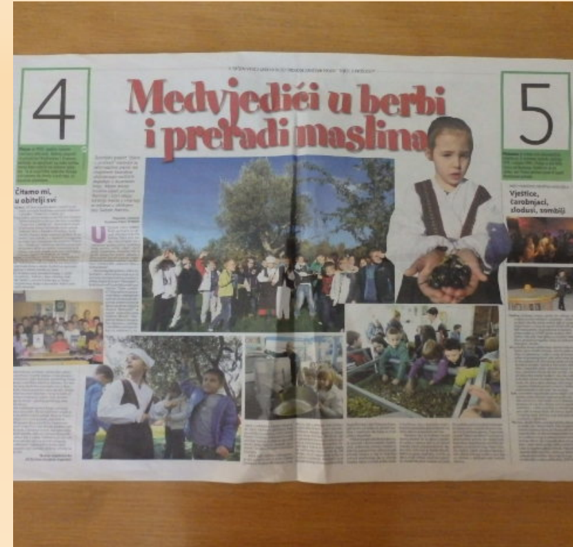
Prilog u Ružmarinu o provođenju projekta