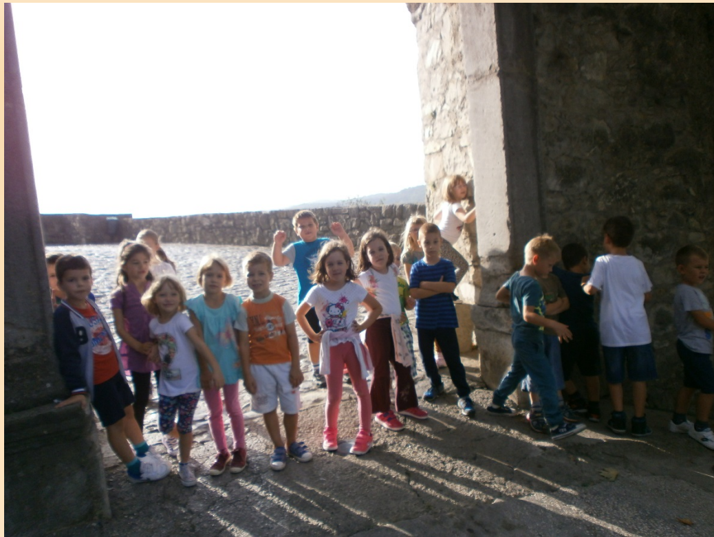
Posjet Starom gradu