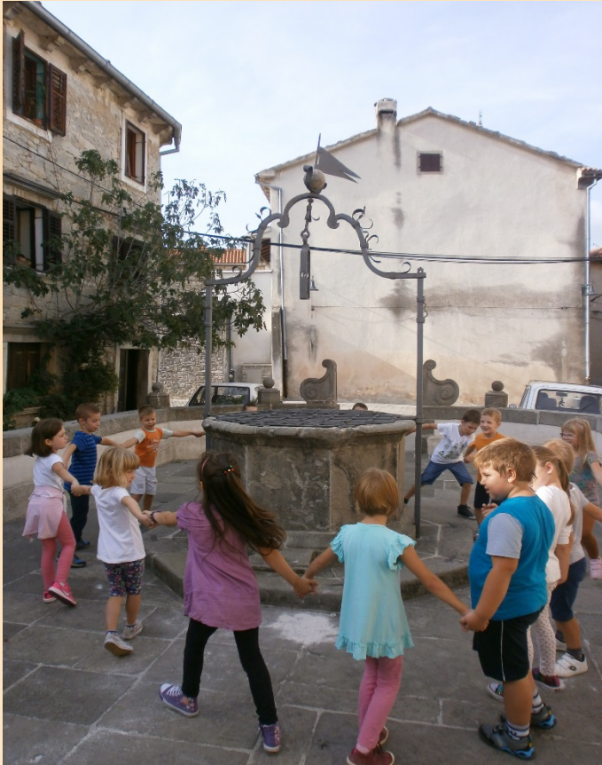
Brojalice na dijalektu