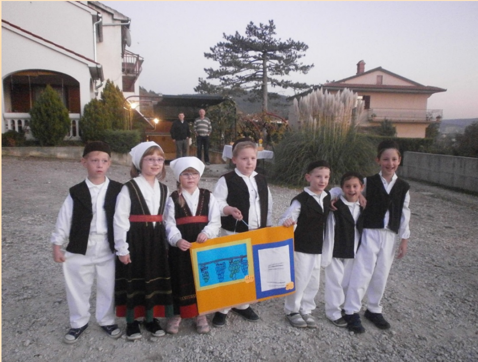
Krštenje vina u mošt – nastup djece „Kako su enbot plesali i kantali”