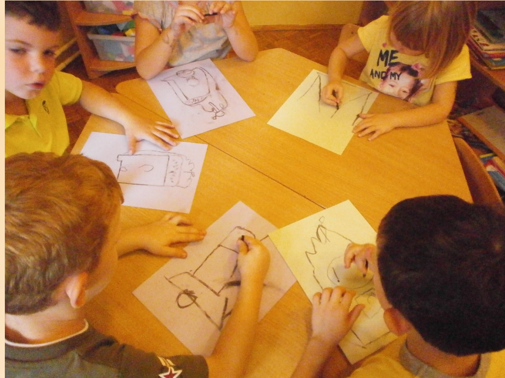
Likovni rad, tema: „Vela šterna“, tehnika: drveni ugljen