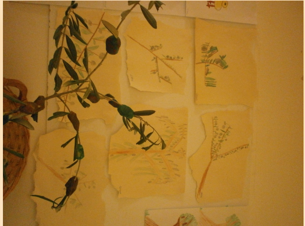
Dječji likovni radovi, tema „Maslina”