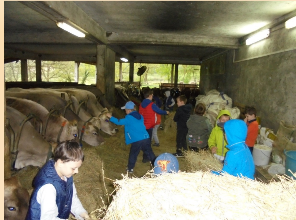
Djeca u staji