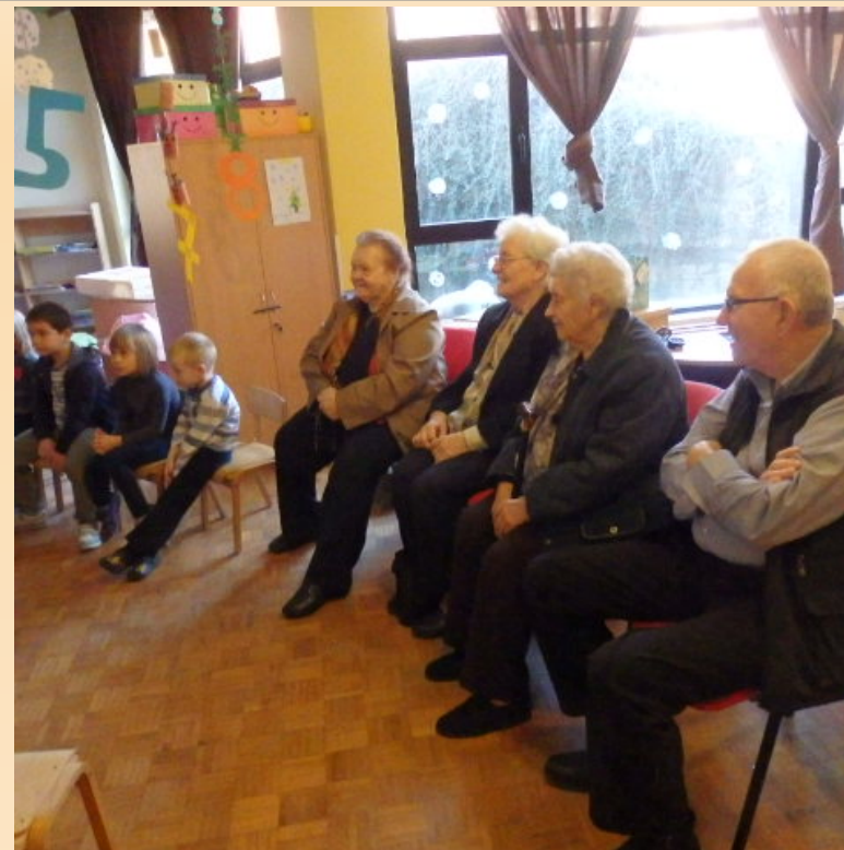
Interaktivna radionica s korisnicima Doma za starije i nemoćne