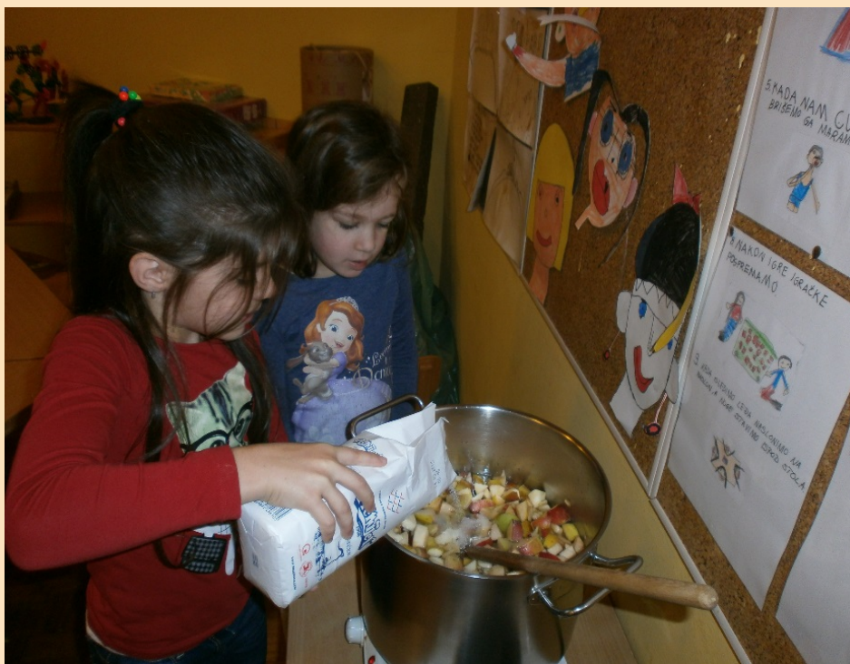
Pripremanje kompota u vrtiću „Učimo od najstarijih”