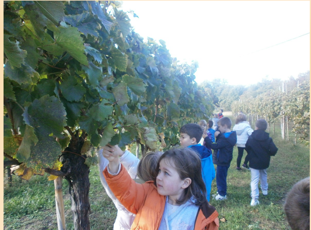
Berba grožđa u Sv. Martinu