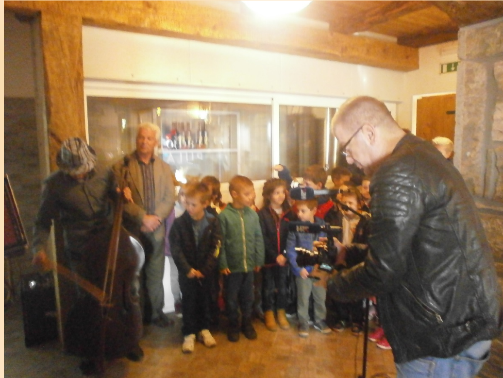
Sudjelovanje djece u emisiji Serđa Valića