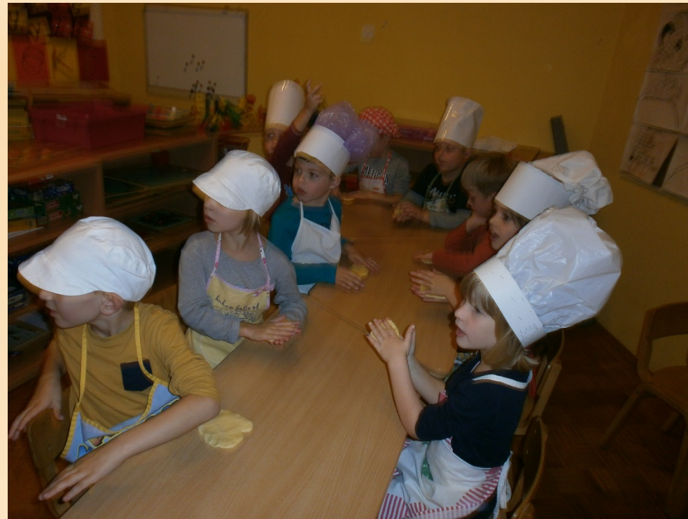
Uskršnja tradicija titole za unuke