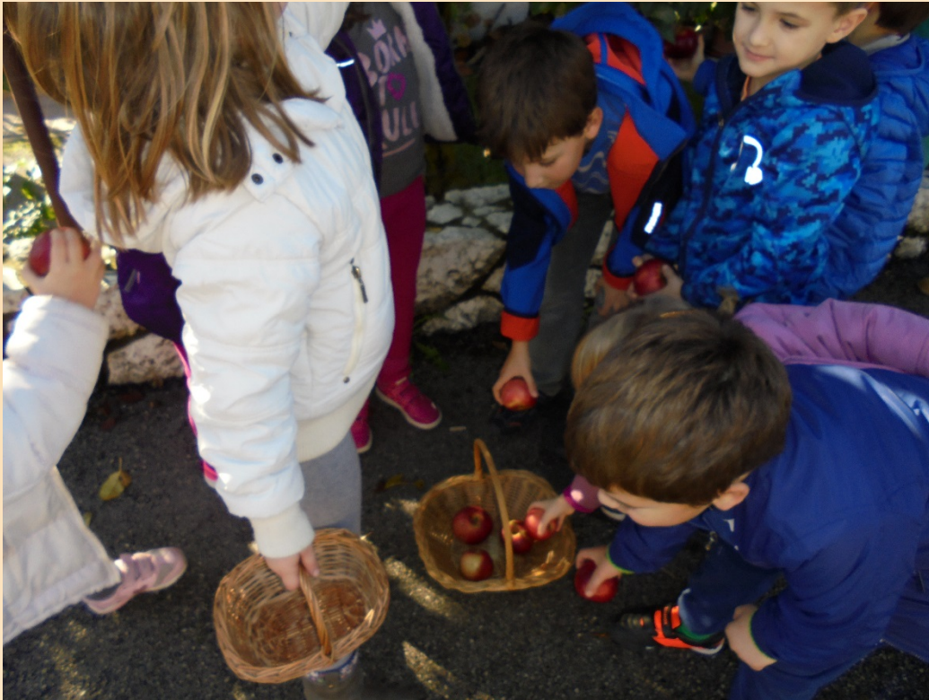
Sakupljanje jabuka za pripremu kompota