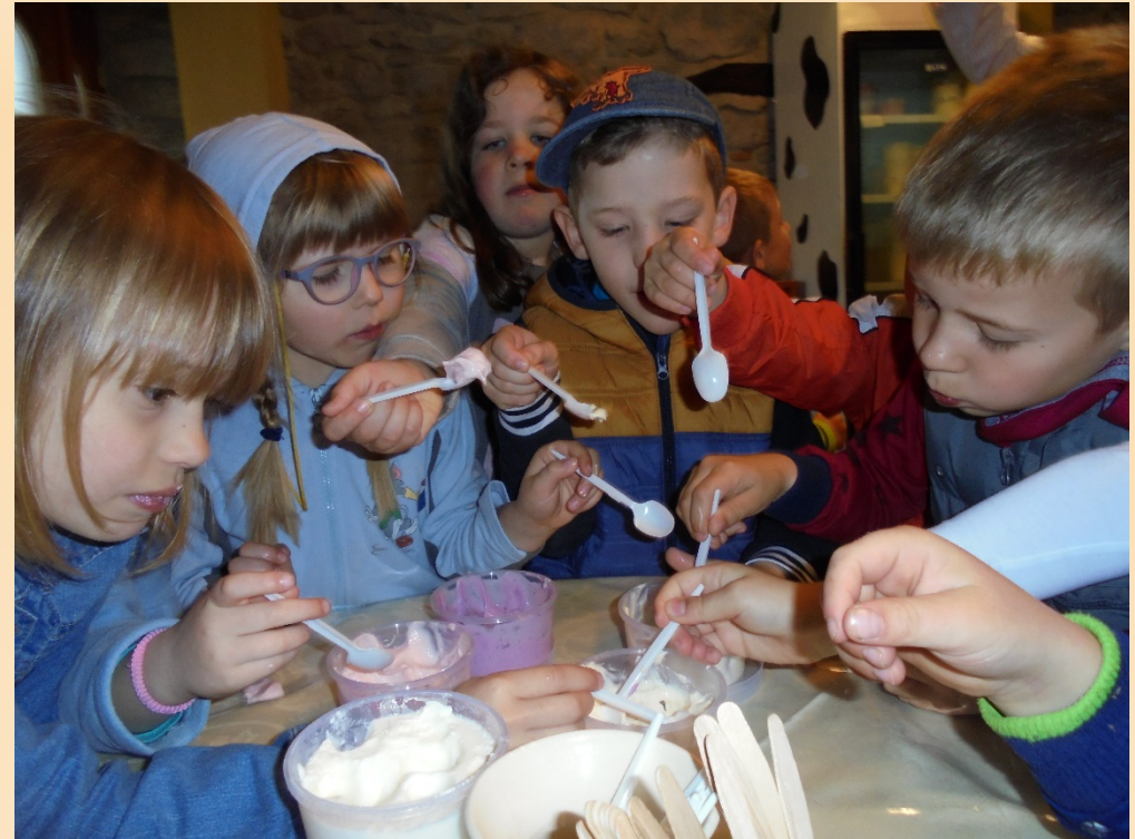
Kušanje domaćih mliječnih proizvoda