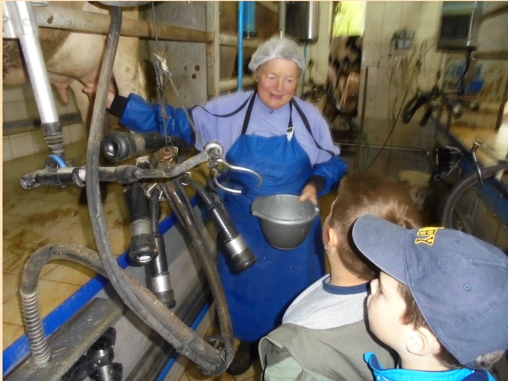
Kako se danas muzu krave...