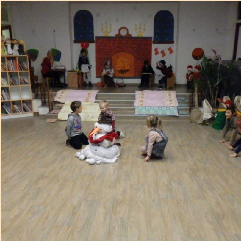
Predstava za roditelje „Božić u fameji”