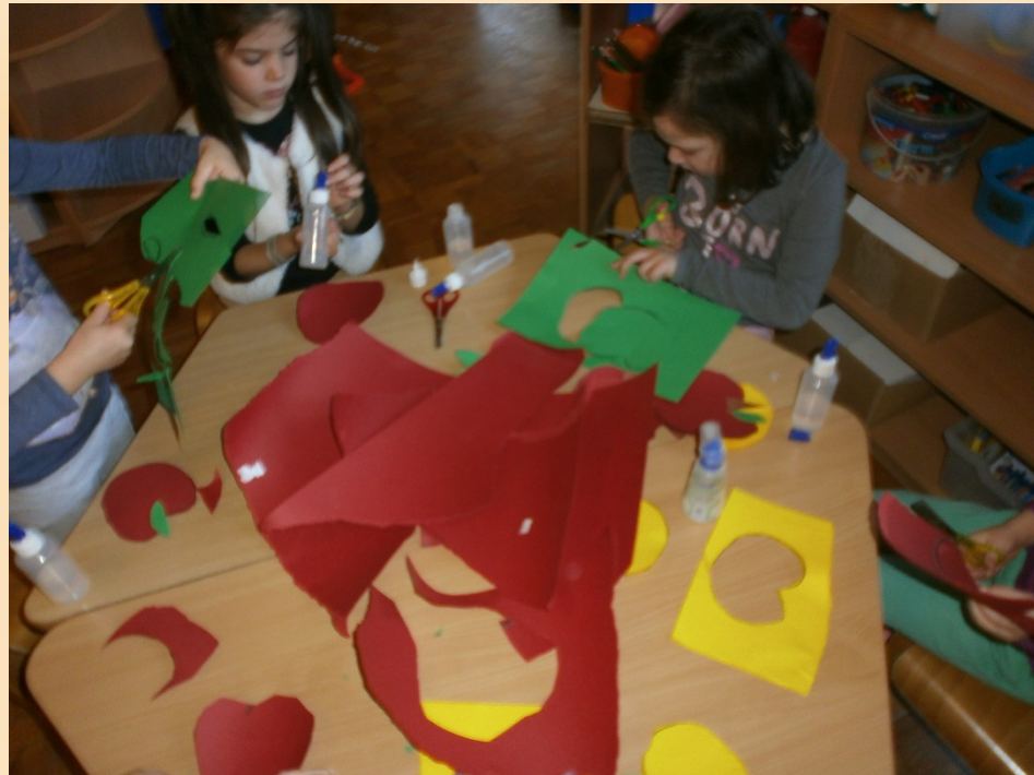
Likovni radovi djece