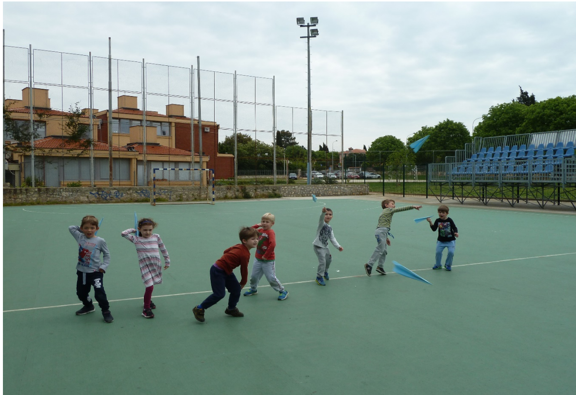
Giochiamo con gli aereoplanini di carta