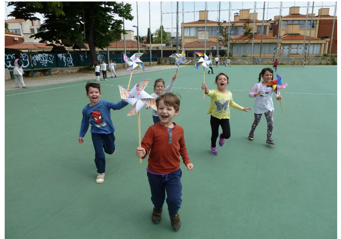
Giochiamo con le girandole