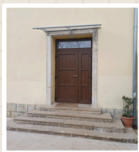
Ulaz u školu

Nastava se održava online zbog pandemije COVID-19.