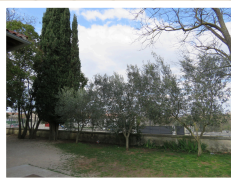
Masline u dvorištu

Uklonjen je bor iz cvjetnjaka. Zasađene su masline. Imamo školski autobus, ne dijelimo ga više s OŠ Svetvinčenat.