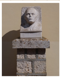
Bista Mihe Županića