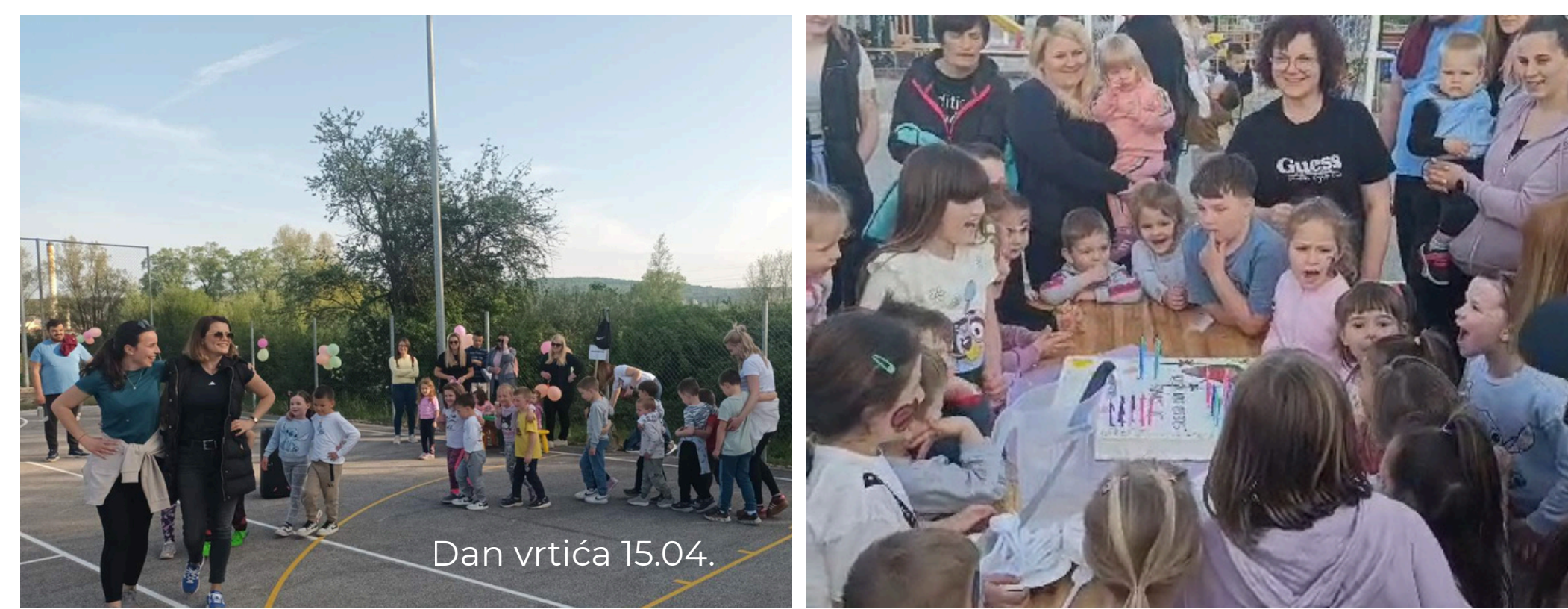
Dan vrtića 15.04.

Harmonika triestina poznata i pod nazivom harmonika na batuniće