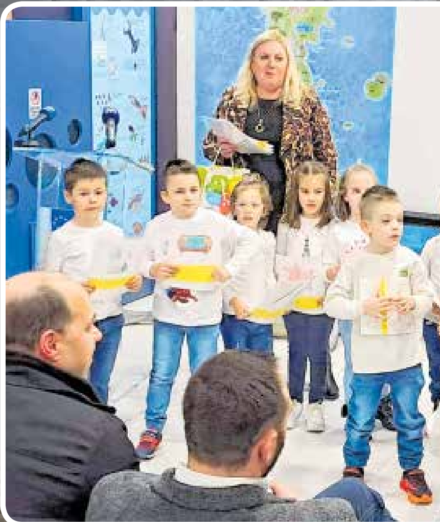
Pogađali smo istarsku besedu