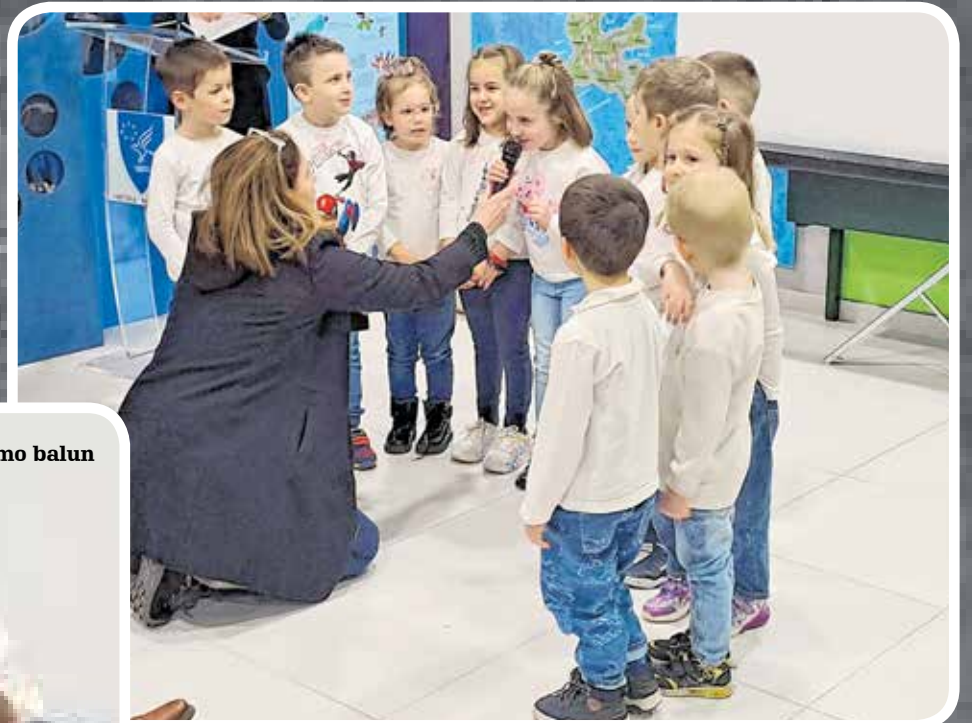
Naučili smo balun