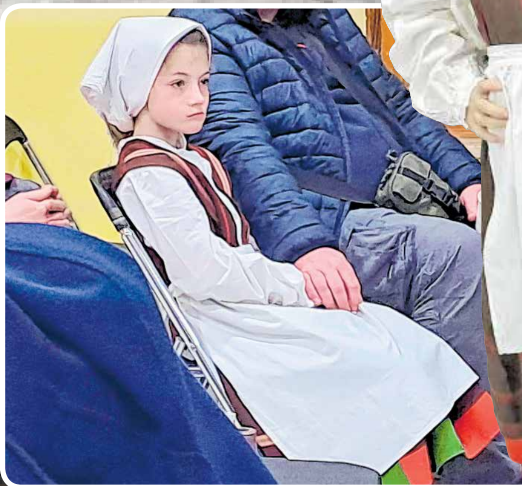
U iščekivanju nastupa