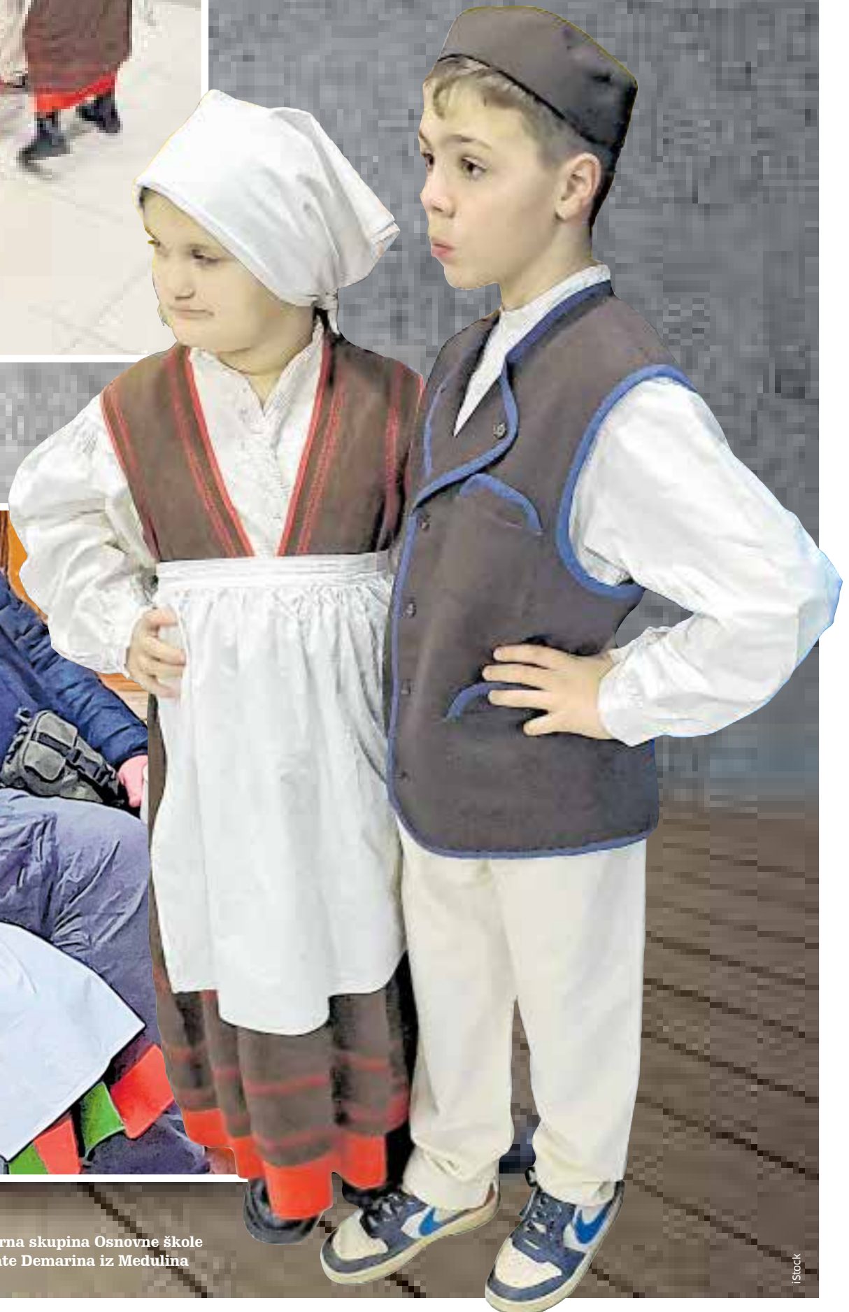
Folklorna skupina Osnovne škole Dr. Mate Demarina iz Medulina