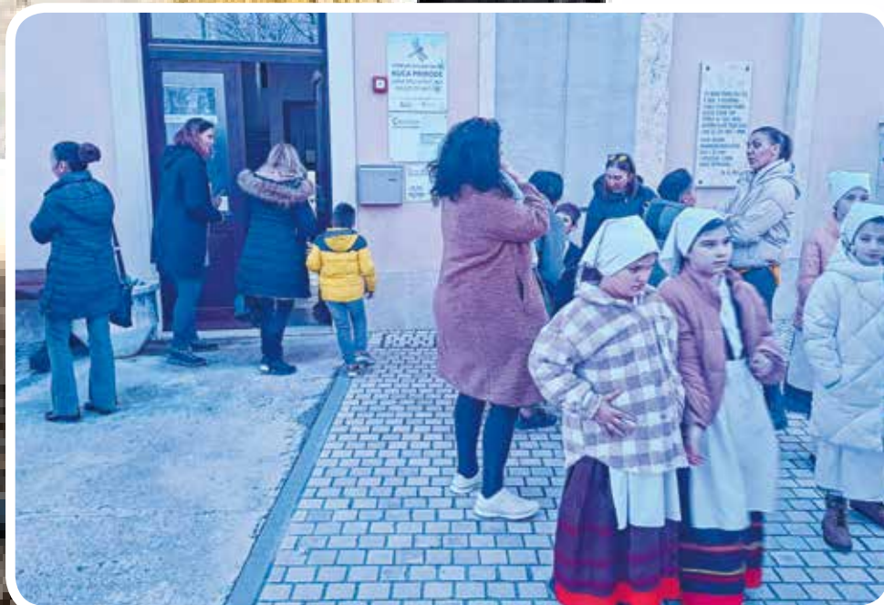
Skup je bio u Kući prirode u Premanturi